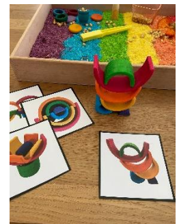
Voorbeeld sensorybox thema kleuren